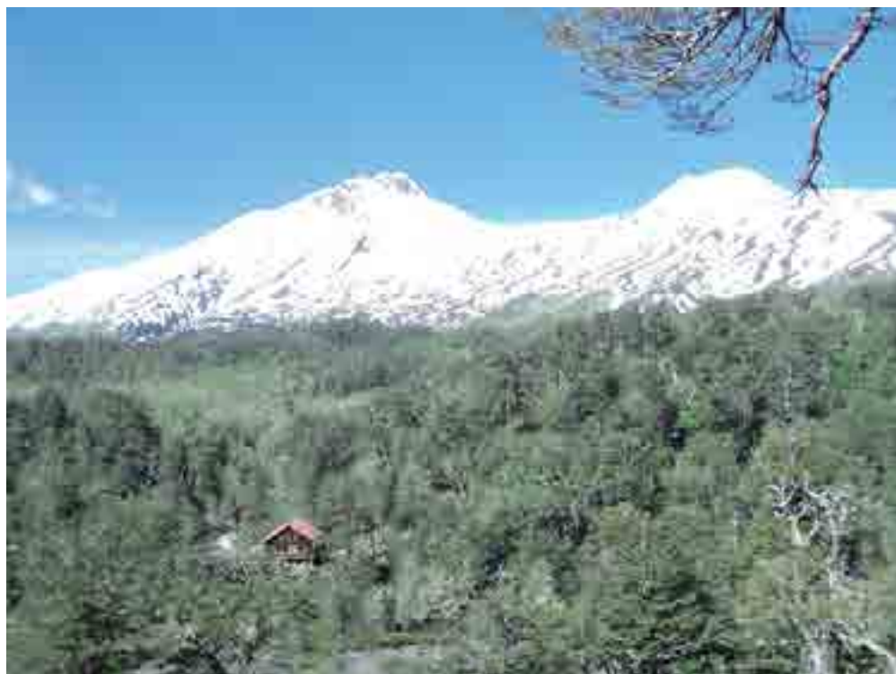
La Conaf, con su gestión logró que el territorio fuera declarado Monumento Natural y la repartición pasó a proteger esta área.