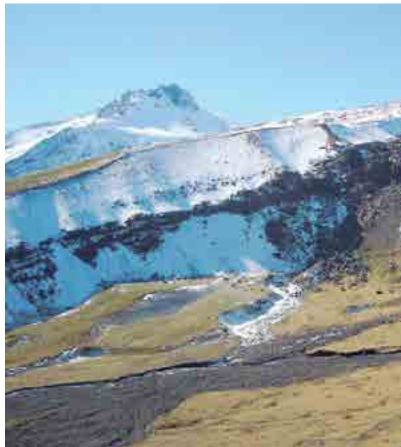
Las altas cumbres del macizo son una atracción para los montañistas

en la temporada estival, ya que se cubre con nieve en invierno.