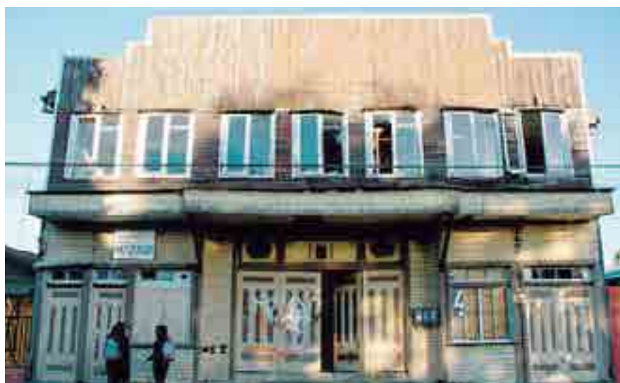
Fachada del edificio en donde funcionó el Cine Galia, ocupado por departamentos municipales de Lanco.

“Es como lo más potente que se está trabajando en este momento, con una línea de futuro”.