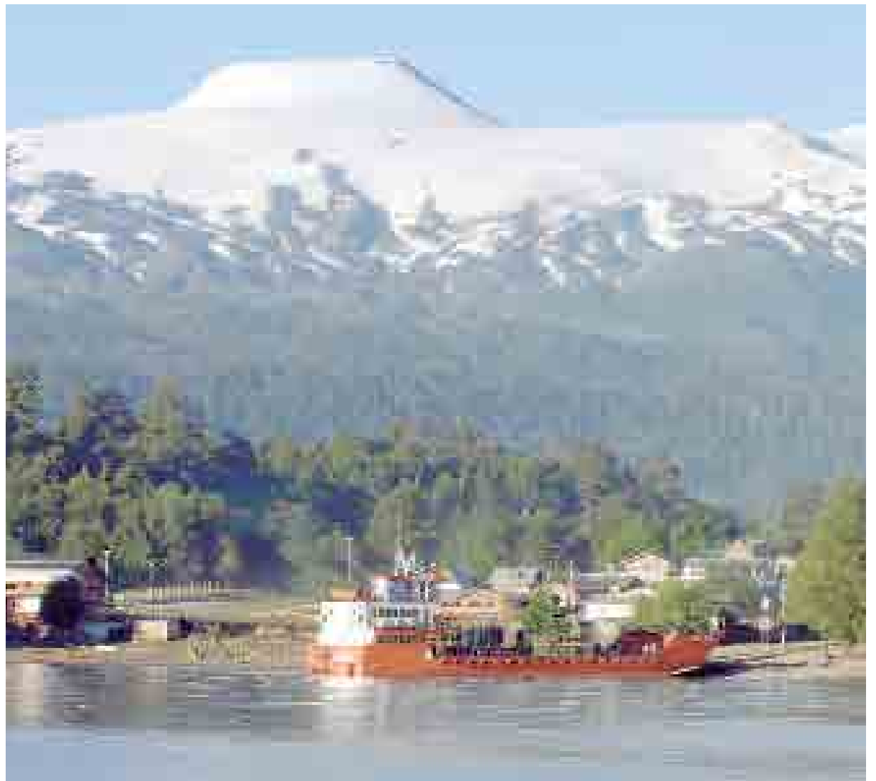
Barcaza Hua Hum, volcán Mocho Choshuenco y el lago Pihueico, una trilogía de elementos que forman parte de la identidad de la comuna de Panguipulli.

Un tiempo después la Conaf, con su gestión logró que el territorio fuera declarado Monumento Natural y la repartición pasó a proteger esta área. Los antiguos integrantes del Club Andino fueron desapareciendo y algunos hijos de aquellos decidieron retomar la tarea. El viejo pero magnífico refugio, que había sido construido con