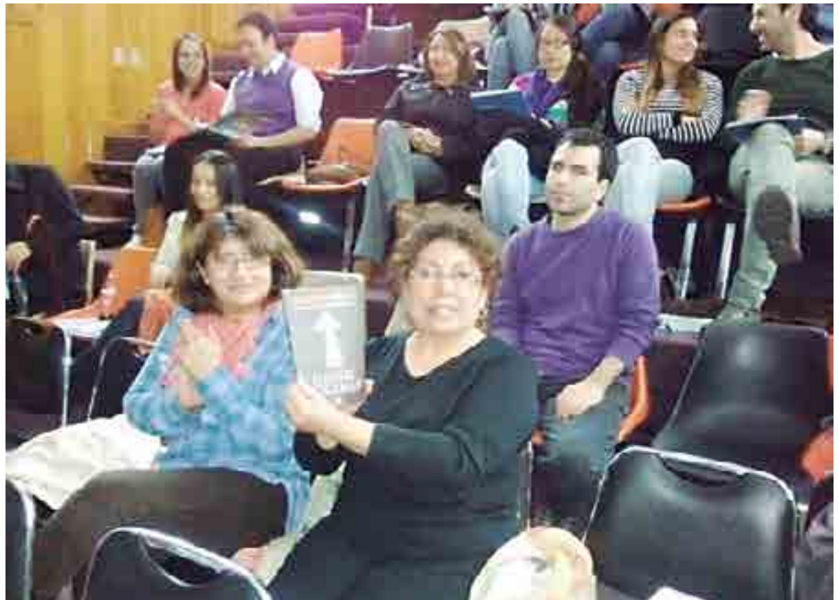
Emprendedores participan activamente en las jornadas de "excelencia emprendedora".

Por mi parte yo comencé a buscar en la web si existía alguna agrupación y encontré esta asociación, me inscribí por la página y luego me llegó un mail para invitarme a una reunión en febrero de 2014 a la que asistí, me