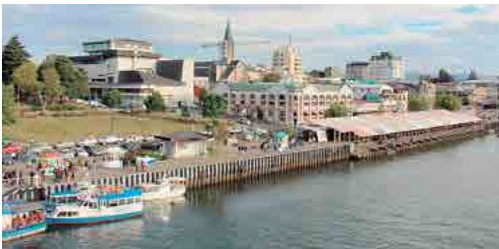
La Corporación Regional de Desarrollo Productivo ha instalado la unidad de Desarrollo Económico Local, encargada de contribuir al mejoramiento de la competitividad y para

El fortalecimiento y apoyo a las comunas en iniciativas de inversión, es uno de los principales ejes para instalar los emprendimientos.