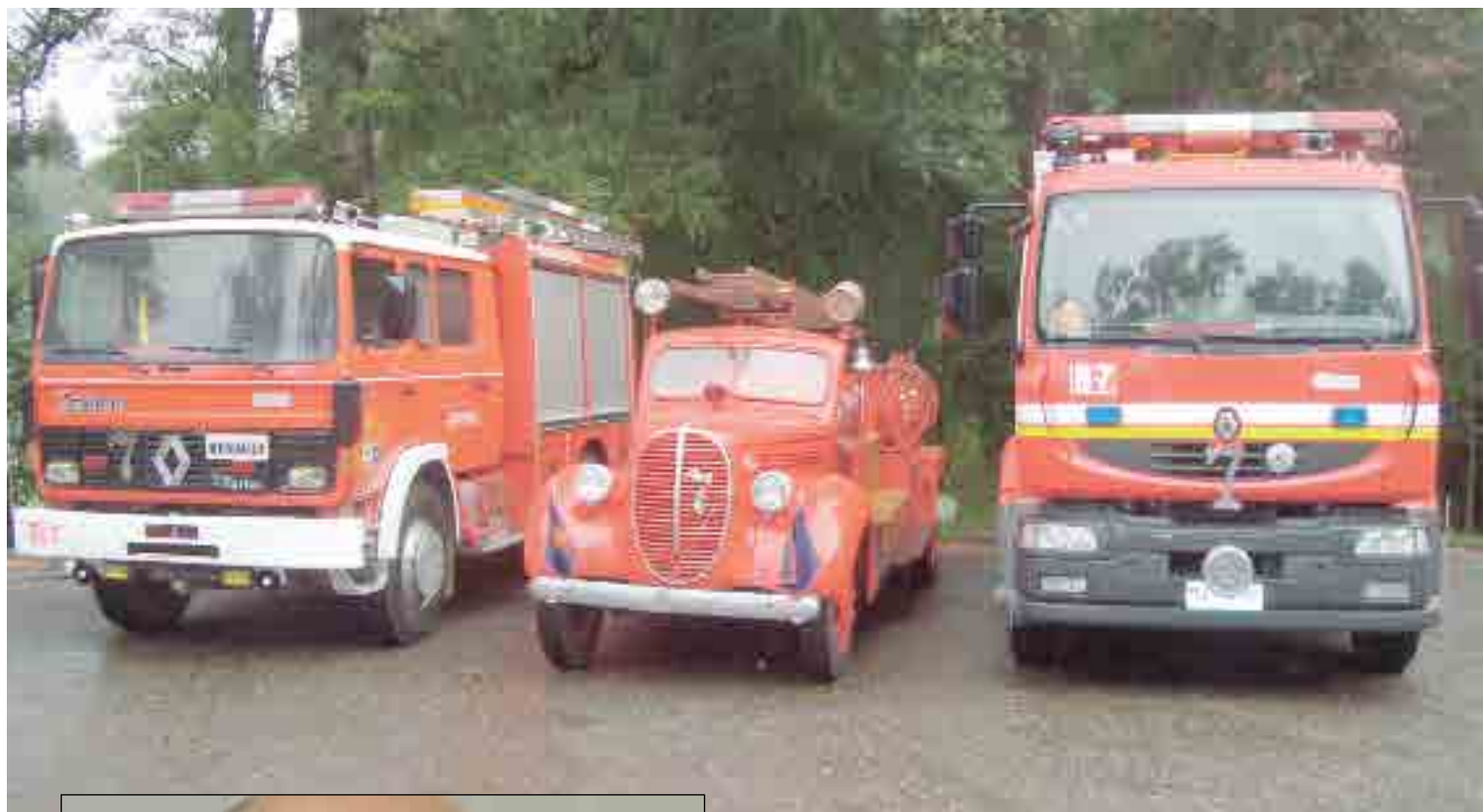
La historia de los cuerpos de Bomberos de la Región de Los Ríos cambiará con estos nuevos recursos.