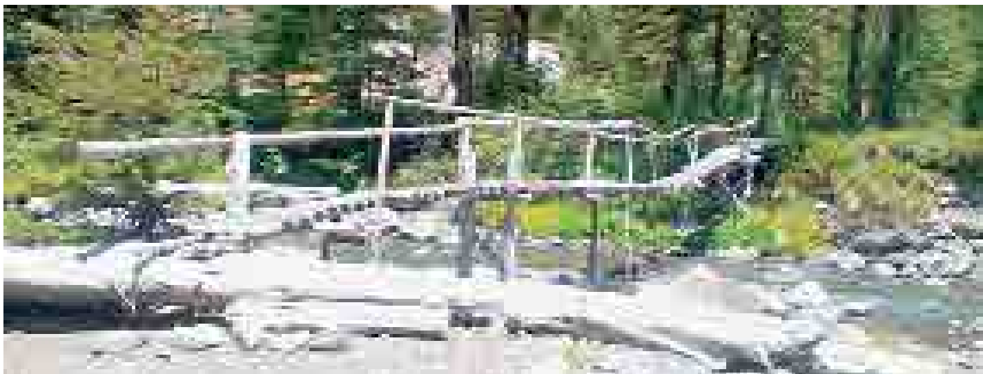
Reserva Nacional Mocho Choshuenco

Desde la ciudad de Panguipulli, pasando por Choshuenco, Chanchán hasta llegar finalmente a Enco, desde ahí se accede a la Reserva Nacional donde actualmente se encuentra ubicado un refugio de montaña que sirve como guardería provisoria para el equipo de guardaparques de la unidad. Desde Enco al área del refugio, el camino es utilizable principalmente