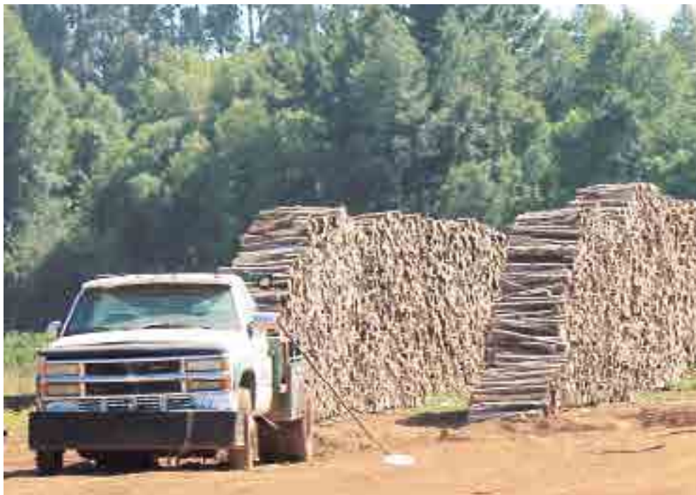
Con más de mil metros de leña cuenta la emprendedora destacada.