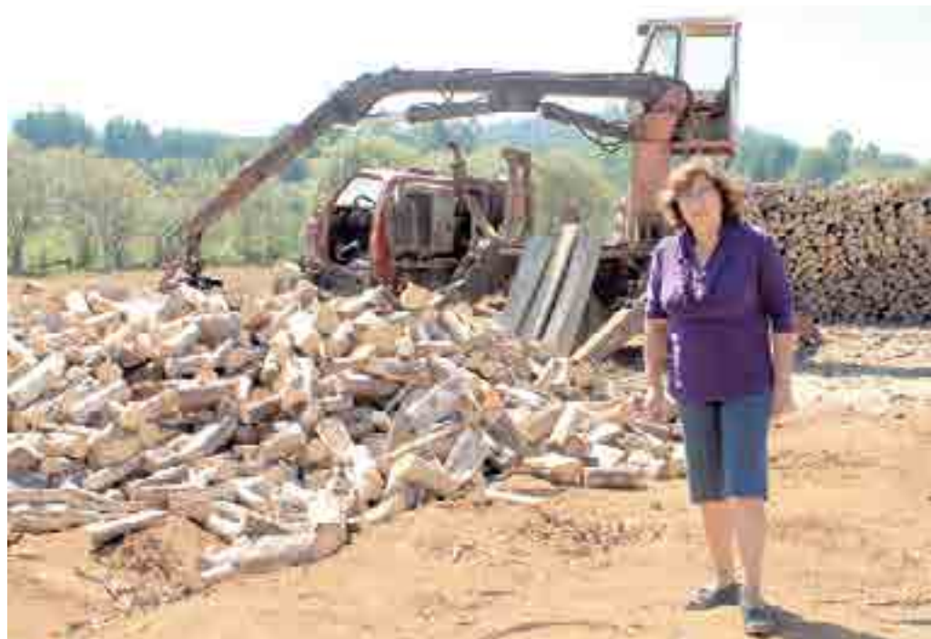
Desde hace cinco años comercia sólo leña certificada.