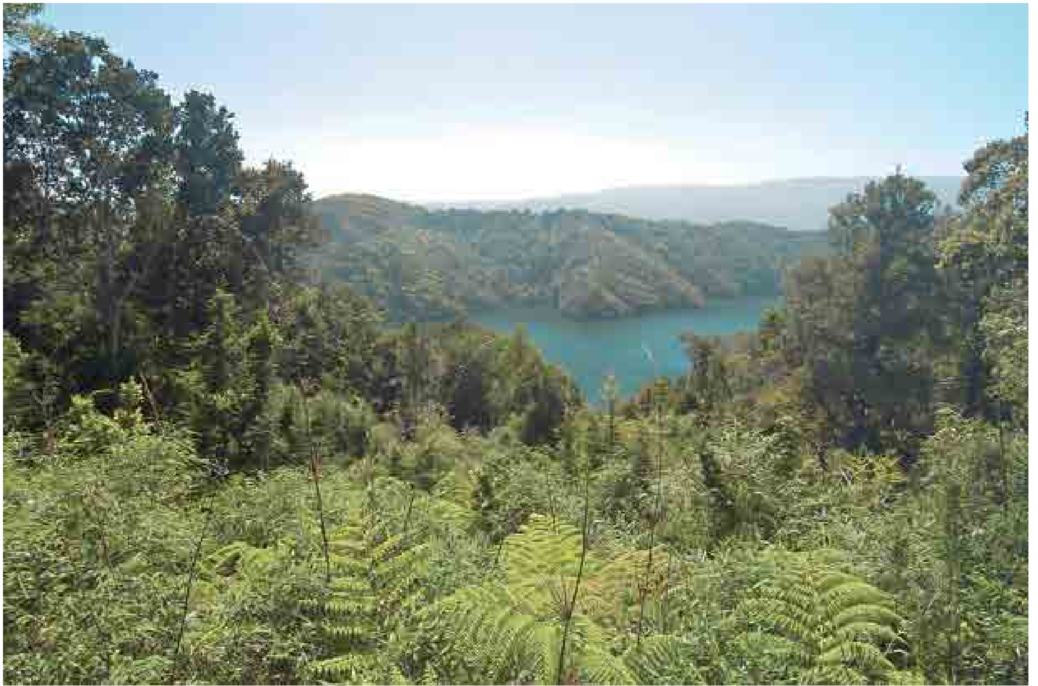
La valoración de los recursos naturales está considerada como un emprendimiento innovador. (Selva Valdiviana).